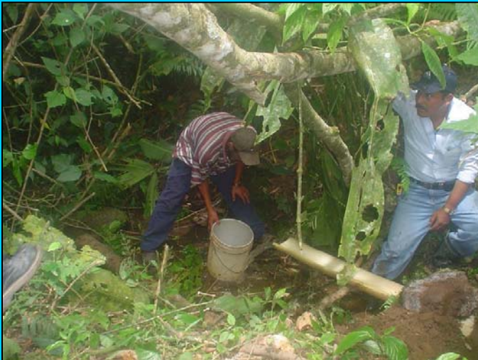
Messung der Quellenkapazität und -qualität