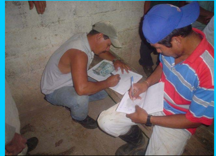
Buchhaltung für den Unterhalt