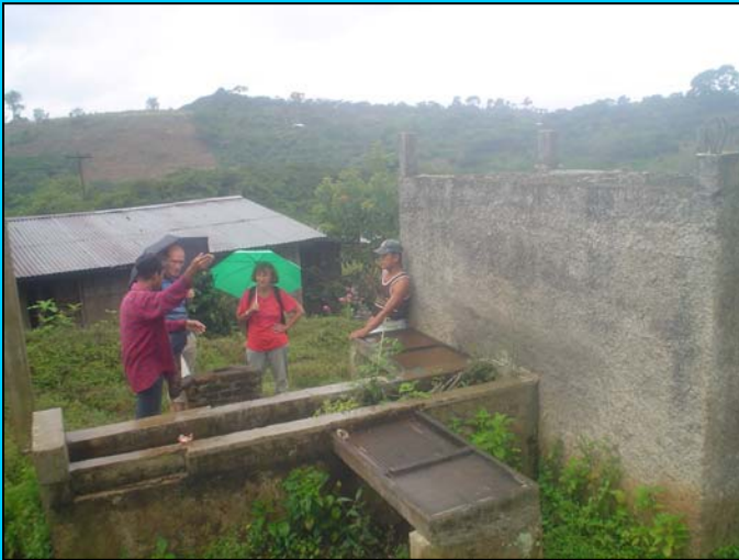
Erster Besuch in vor Ort