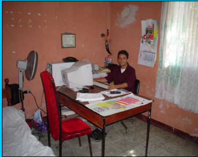
Viel Engagement von Filemon...