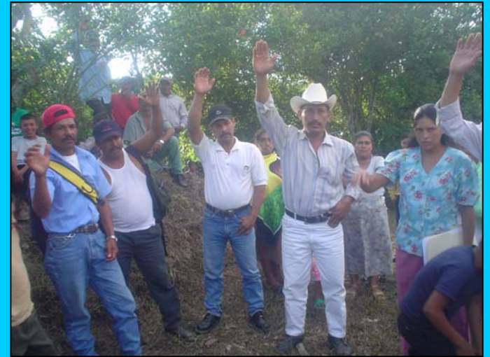
und der Bevölkerung sind Voraussetzung!