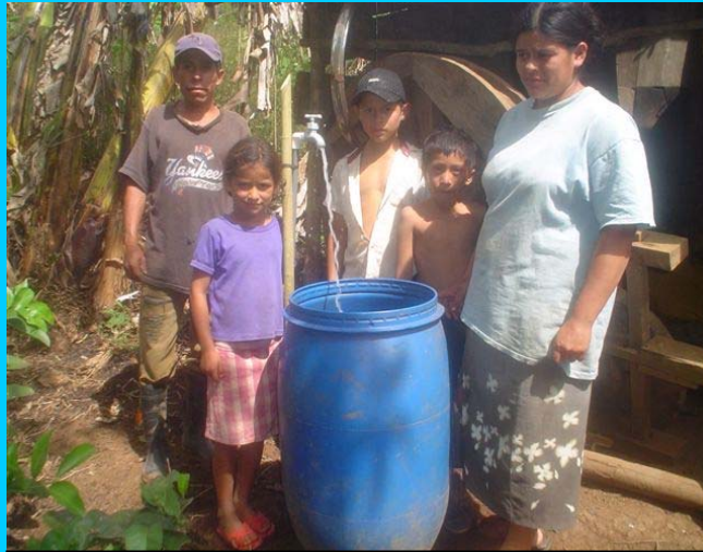
Endlich gutes und frische Wasser