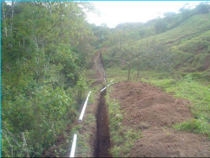
Installation der Hauptleitung